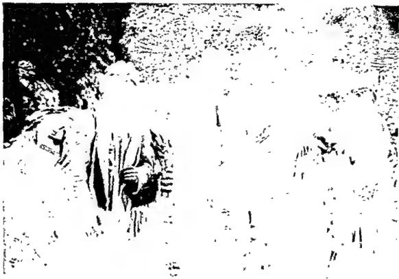
लेखक हिमालय के यायावर परिवार के साथ प्रवास में